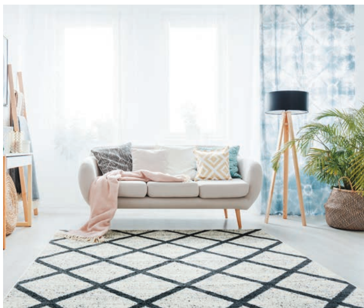
Des appartements généreux en lumière dont certaines pièces aménagées dans les combles