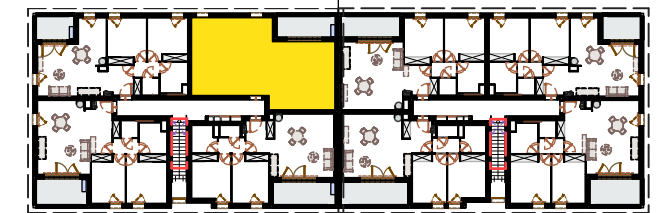
B | A