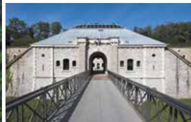
Une activité culturelle intense au sein de l'Iris, de la médiathèque et du fort du Bruissin.