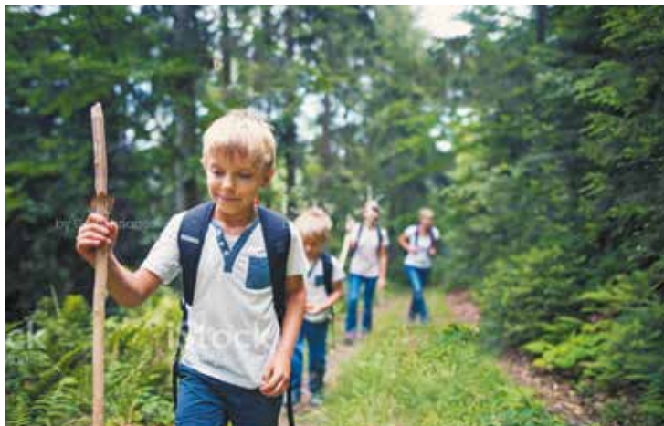
Francheville, par son accessibilité, permet de travailler dans la Métropole et de vivre au cœur des paysages vallonnés des Monts du Lyonnais.

Bois et parcs composent la moitié du territoire de la commune, de quoi prendre l'air et profiter de tout l'ouest lyonnais qui s'offre à vous.