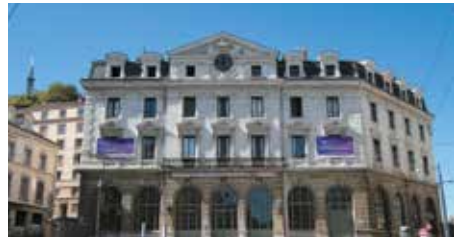
Place Bellecour, à 15 minutes en voiture. Gare à Saint-Paul à 14 minutes en TER.